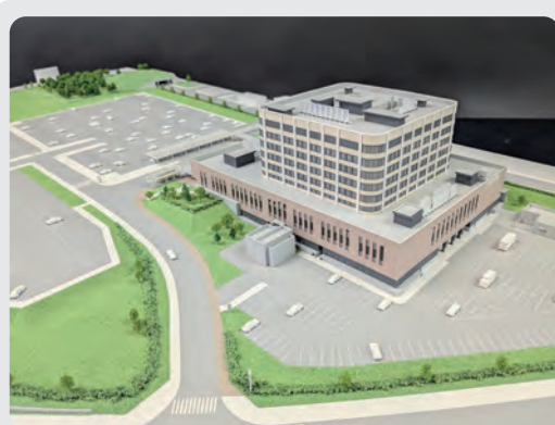
新病院の完成予想模型を展示しています 場所 市立総合病院 1階正面入口

経営統合や新病院建設に関する情報は、市立総合病院ホームページ、または北海道中央労災病院ホームページをご覧ください。